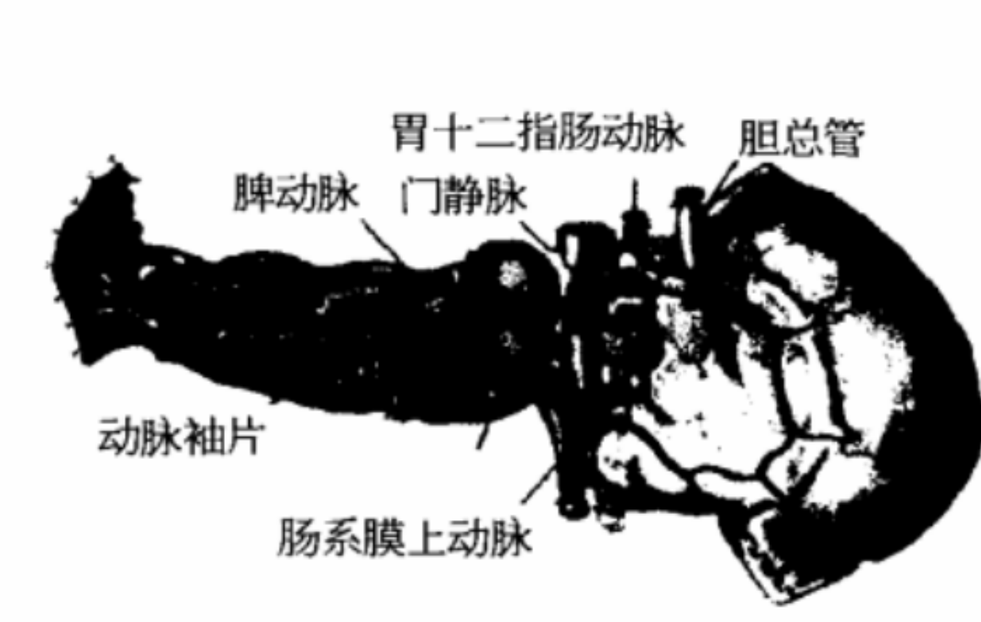
图2 移植物修整示意图

首先分离双侧肾脏,切开腹主动脉,确认出腹腔干、肠系膜上动脉及左右肾动脉后,分别游离左右肾动脉开口;注意有无血管变异,防止误伤血管。处理右肾动脉向肾门方向游离时注意勿损伤下方的左肾静脉。紧贴右肾上极结扎切断,注意勿损伤十二指肠和胰头部。然后处理左肾,在切断脾肾韧带时也要紧贴肾脏防止损伤胰腺下缘。移去双侧肾脏。接着切除脾脏,结扎胰近端的脾动静脉残端。在胰十二指肠上缘分别结扎肝动脉、胃左动脉、胆总管。由于不同时切取肝脏,不必非常彻底地解剖腹腔干,只要做到确切结扎即可。然后沿腹腔动脉和肠系膜上动脉开口的边缘,修剪腹主动脉,使其成一袖口片状,约2.0 cm以供吻合用。在胰腺下缘1.5 cm处分别结扎肠系膜上动脉及肠系膜下静脉,游离脾静脉,并带门静脉袖片,切除远近两端多余的肠段,缝闭十二指肠残端 [4] (图2)。修整胰周时应注意仔细分束结扎残留的小肠系膜,否则通血后极易造成难以控制的出血。